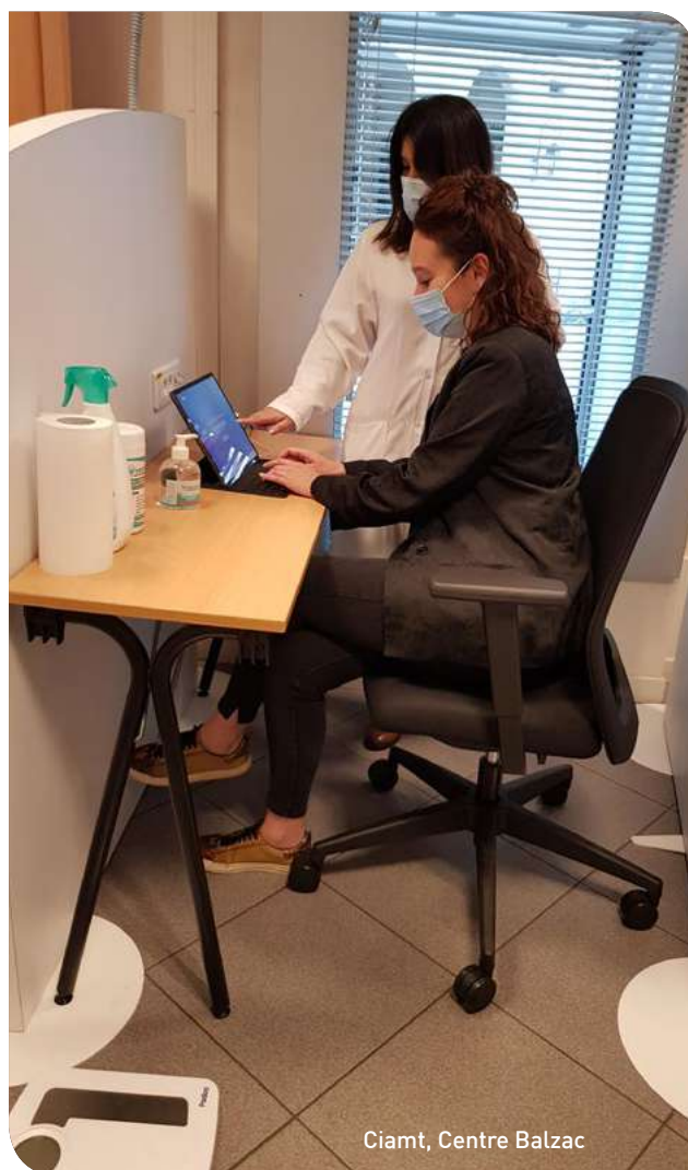
Ciamt, Centre Balzac

Entre deux visites, le salarié, s'il le souhaite, pourra bénéficier d'un accompagnement spécifique : il recevra des éléments d'information, des conseils, un « coaching » personnalisés en fonction de son profil, de ses risques et de ses facteurs de vulnérabilité. Par exemple, votre salarié exerce un métier qui l'expose au risque routier ? Il se verra plus particulièrement proposer des conseils sur le sommeil ou l'alcool, ou une formation pour améliorer sa conduite.